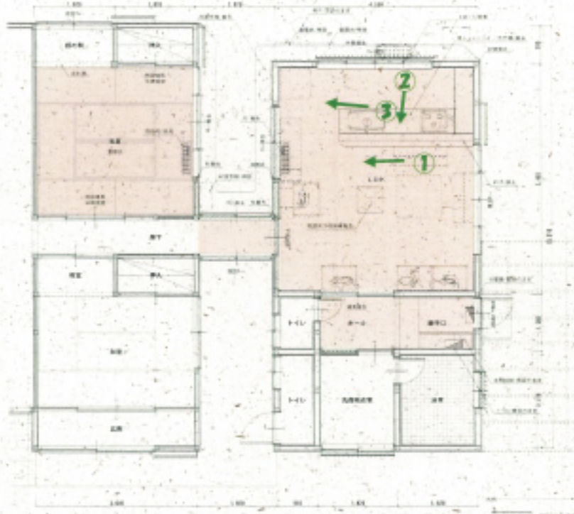
一階リフォーム前平面図 縮尺 1/100