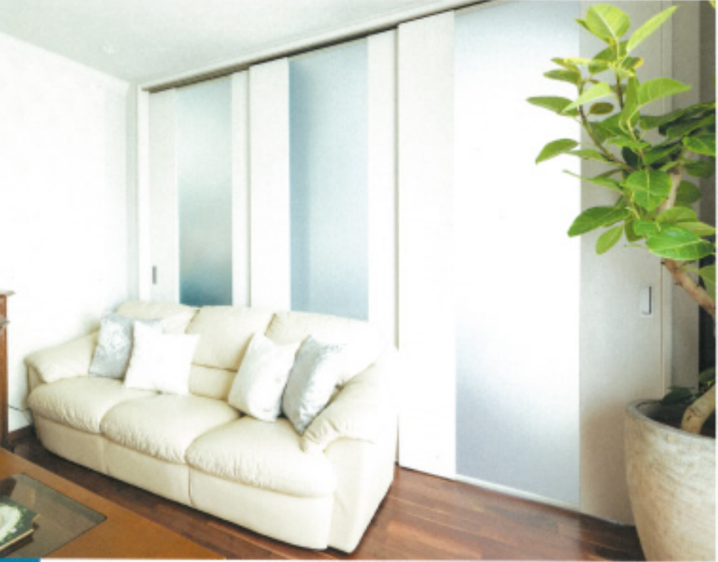
5 つながる空間、めける視線