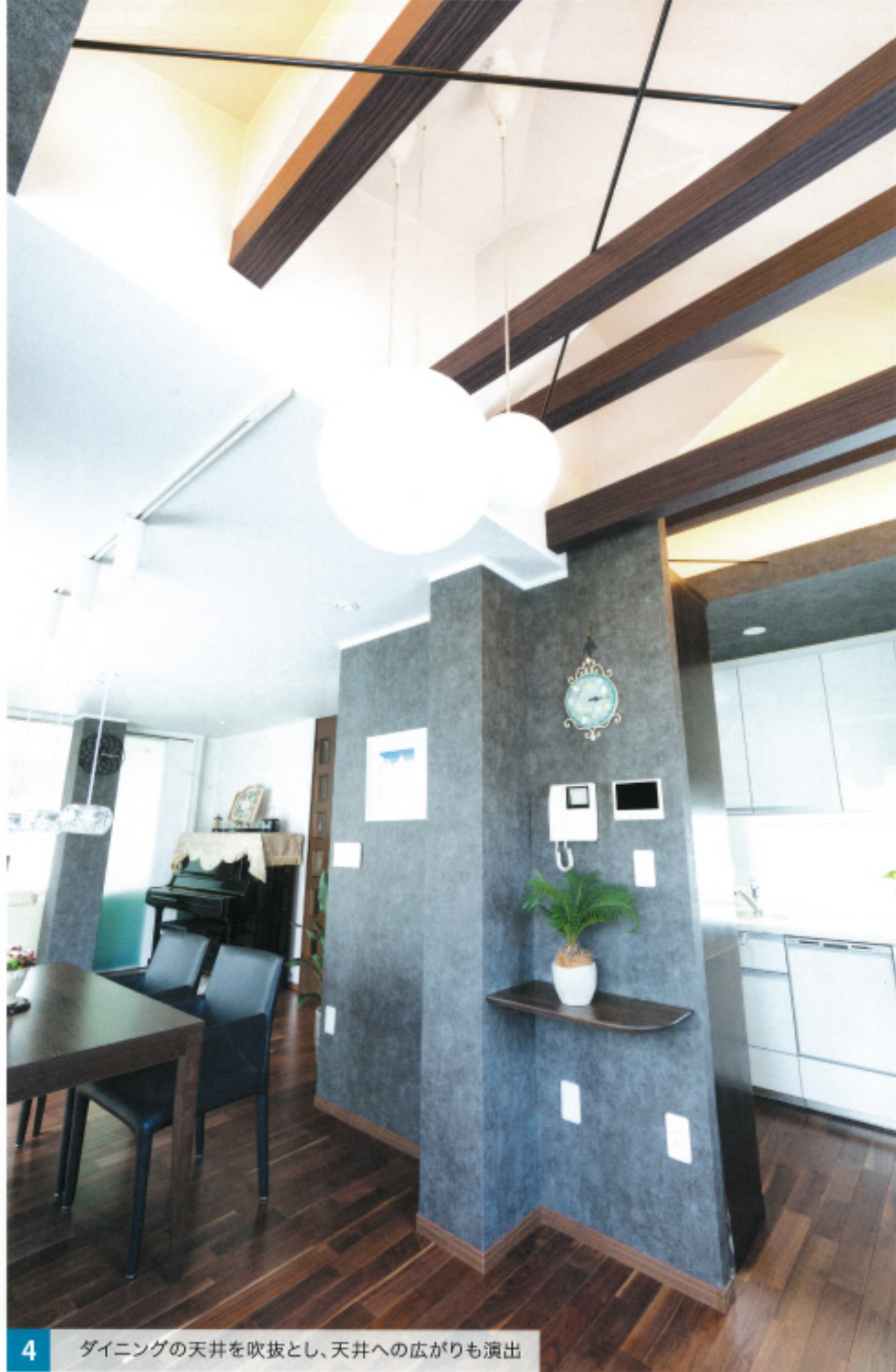
4 ダイニングの天井を吹抜とし、天井への広がりも演出

5 リビング ダイニングとリビングの引き戸を開け放せば4つの部屋が奥様中心となるような大空間に変身。