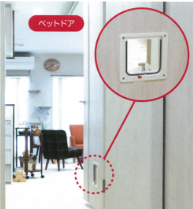
3 自由に入出りできるモコ専用の特注ドア