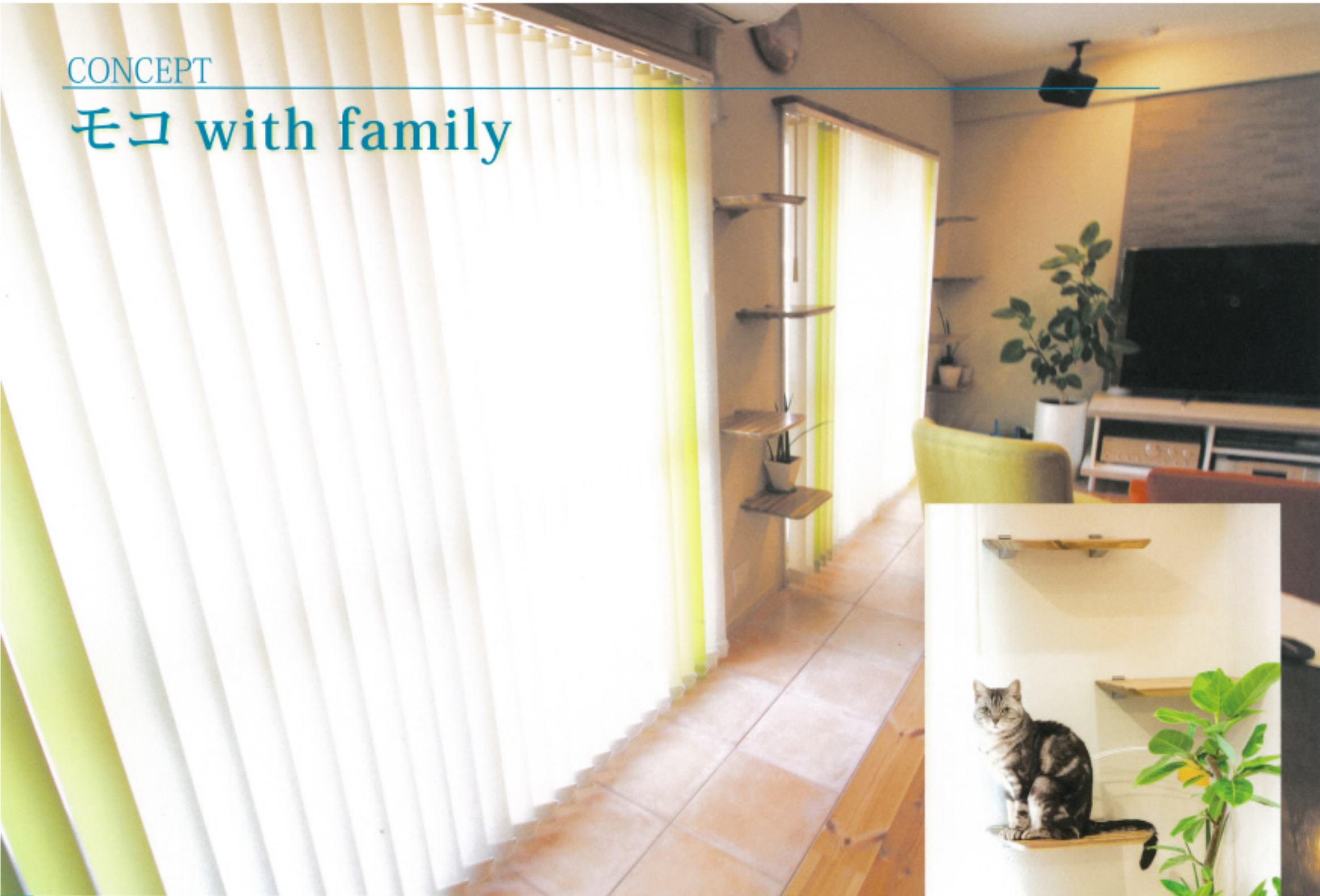
1 行動パターンにあわせた、タイル貼りの床が居心地良いひなたぼっこスペース