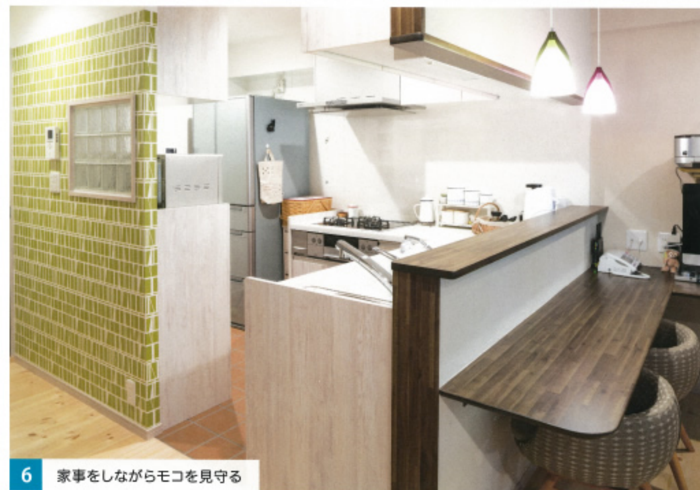
6 家事をしながらモコを見守る